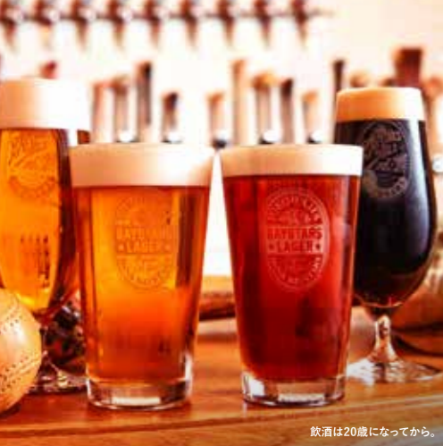
飲酒は20歳になってから。

MAP NO. ① & 9 (アンド・ナイン) ベースターズオリジナルビールを始め、 常時10種類以上のクラフトビールが楽しめる。